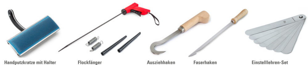
Handputzkratze mit Halter